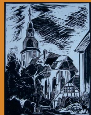
Helgard Flügge | Naunhof