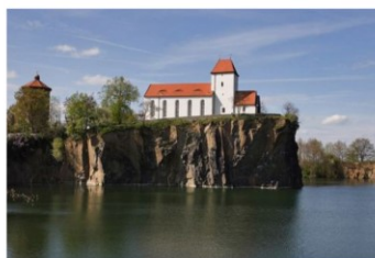
Der Beuchaer Kirchberg besteht aus Granitporphyr, der hier seit dem 15. Jahrhundert gebrochen wurde und von einem 3,5 Hektar großen See umgeben ist.