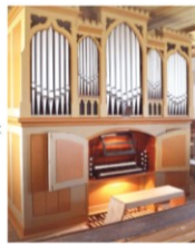
Orgel Polenz (Foto: Peter Kreyenberg)

18:15 Uhr Begrüßung 18:30 Uhr „Wir liegen hier und es ist schön“ Schwebende Klänge und sommerliche Texte mit Kantor Konstantin Heydenreich, Pfarrer Christoph Steinert und Gästen 19:30 Uhr Musik des Polenzer Bläsertrios 20:00 Uhr Eine Geschichte über Polenz 21:00 Uhr Nachtgedanken 21:30 Uhr Turmbesteigung und nettes Beisammensein für Jung und Alt bei einem Glas Wein 24:00 Uhr Glockenläuten zur Nacht